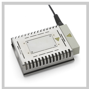
Piastre per preriscaldamento